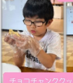
チョコチャンククッキー