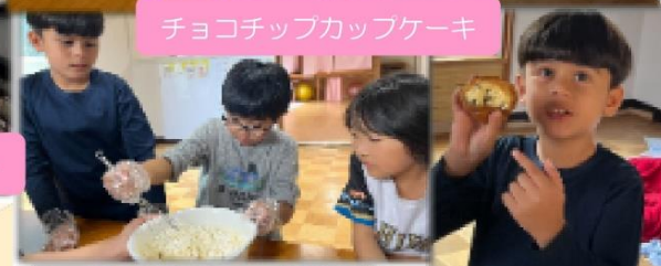
チョコチップカップケーキ

おやつ作り スモアクッキー、チョコチップカップケーキ、フルーツヨーグルト作りなどを行いました。カップケーキ作りでは、作り方の紙を見ながら「卵割りたい人ー?」「〇〇はこれやる?」とお互いに声をかけながら子どもたちが自ら役割分担をして進めていました。おやつ作りも回数を重ねて流れがつかめたのか子どもたちが率先して行うようになっていて成長を感じます😊