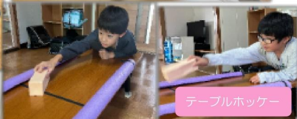
テーブルホッケー