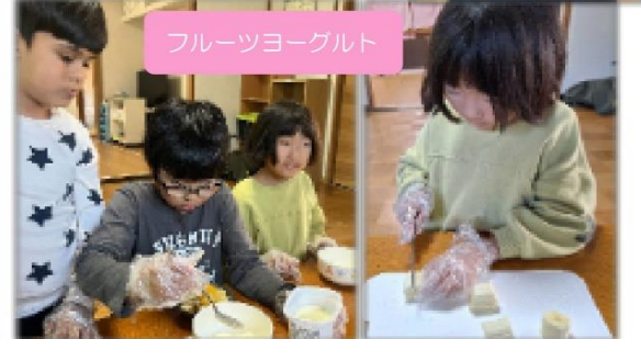
フルーツヨーグルト

おやつ作り スモアクッキー、チョコチップカップケーキ、フルーツヨーグルト作りなどを行いました。カップケーキ作りでは、作り方の紙を見ながら「卵割りたい人ー?」「〇〇はこれやる?」とお互いに声をかけながら子どもたちが自ら役割分担をして進めていました。おやつ作りも回数を重ねて流れがつかめたのか子どもたちが率先して行うようになっていて成長を感じます😊