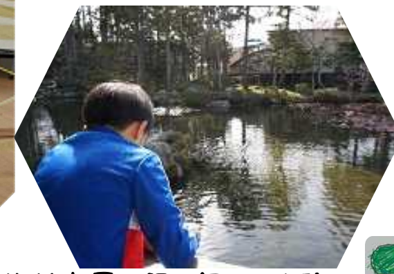
梅村庭園で鯉に餌やり体験!!!