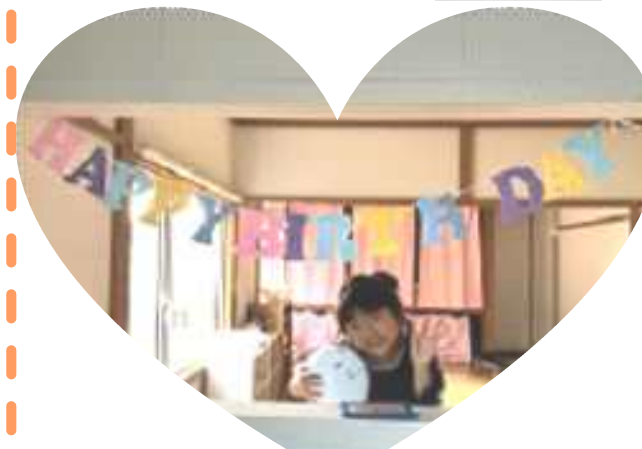
誕生日の方おめでとうございます！