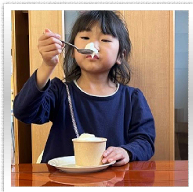
お誕生日会では希望によってソフトクリームかプリンが食べれます!!!