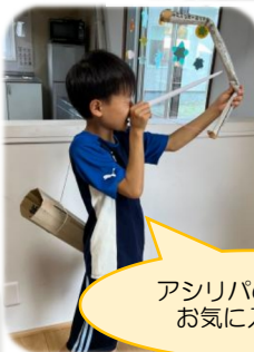
アシリパの矢筒が お気に入り☺