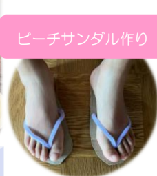
ビーチサンダル作り