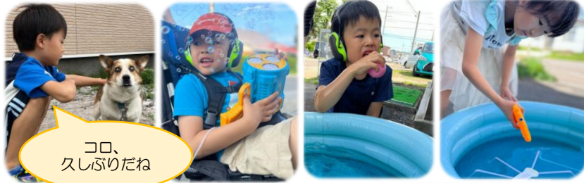
コロ、 久しぶりだね

夏休みが終わりましたが、まだまだ暑い日が続いていますね。子どもたちは、ファインに来てすぐ「海に行ったよ!」「虫をとりに行ったよ!」と夏休み中のご家庭での出来事を嬉しそうに話してくれました! こんがりと焼けた子どもたちは体もたくましく、大きくなったように感じます。夏の疲れが出てくる頃ですので、たくさんご飯を食べ、十分に睡眠をとって元気に秋を迎えましょう!