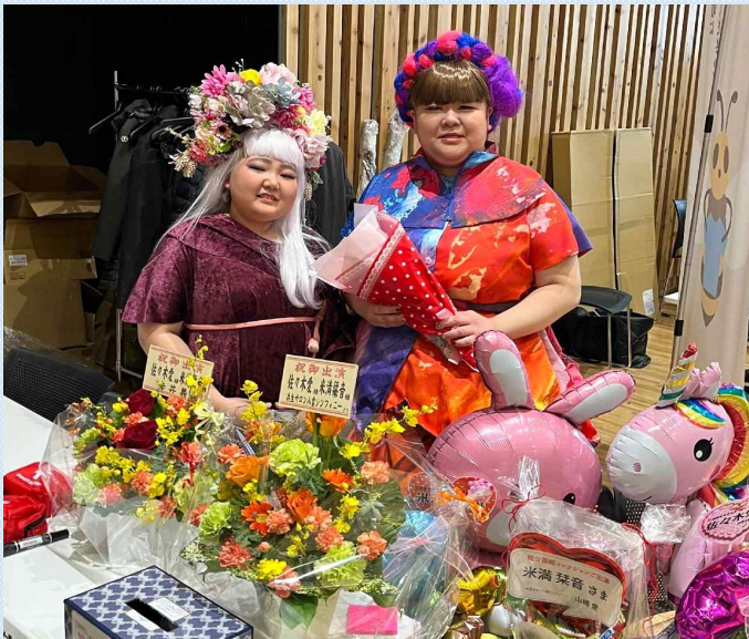
函館コレクションに利用者が2名参加しました！