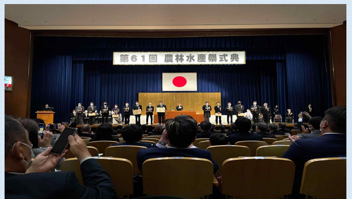
厳かな会場でした...