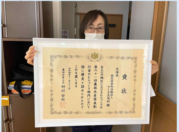
賞状はこちらです！